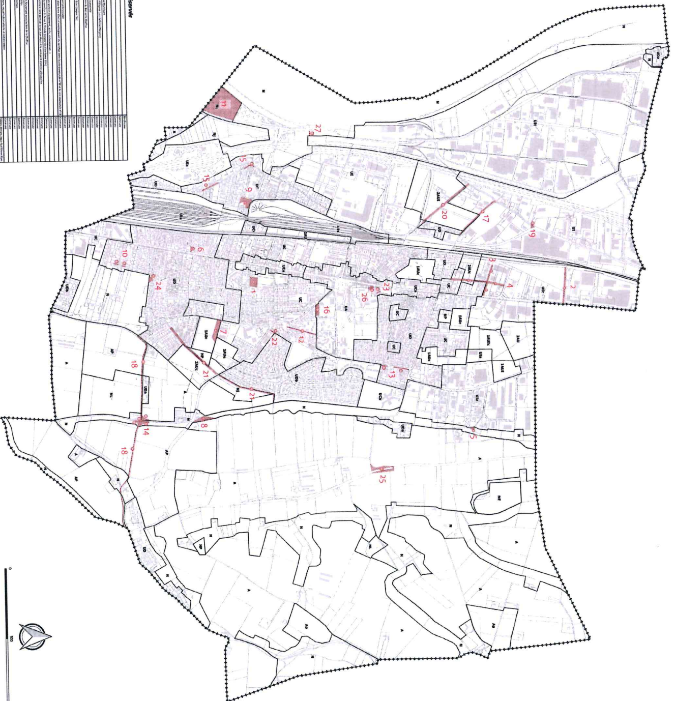
Liste des emplacements réservés